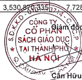
Cần Hữu Hải